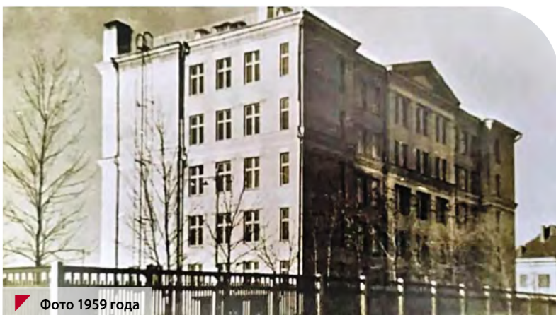
Фото 1959 года